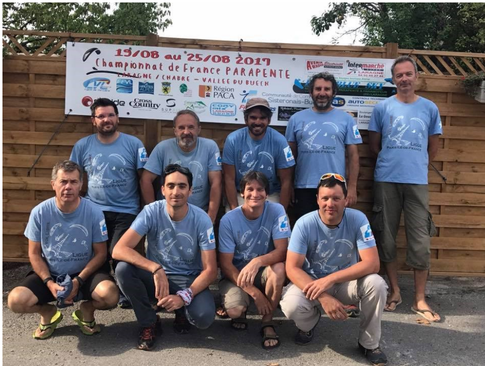
Photo : les 9 pilotes de l'équipe PIFD aux Championnats de France à Laragne

12 pilotes ont participé à des compétitions internationales. Rappelons que ces compétitions se déroulent sur 5 jours, ce qui permet la garantie de courir plusieurs manches même en cas de météo difficile, et de mettre en œuvre une stratégie pour le classement général tout au long de la semaine.